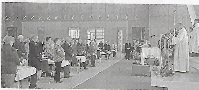
C'est dans le gymnase que s'est tenue la messe dominicale.