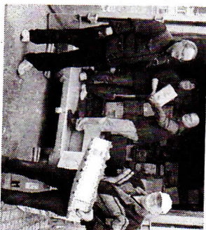
Un ramassage de vieux papier dont les bénéfices vont à des projets pour les enfants des écoles.

Dimanche prochain 13 avril de 10 h à 16 h, la même association organisera une bourse aux livres, disques, CD et DVD à l'espace socioculturel de Schirrhein. Renseignement : Valérie Wolff-Dorffer ☎03 88 63 67 13 entre 17 h 30 et 20 h.